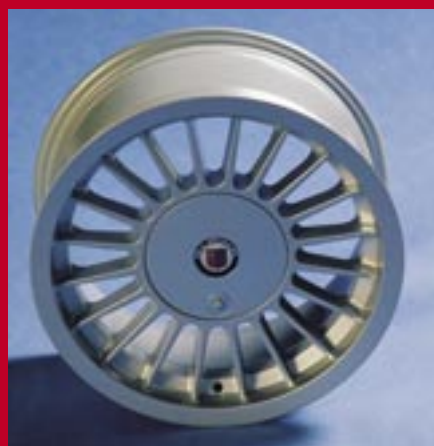
ALPINA Rad 15"

zulässige Sommer- u. Winterbereifung* rundum 205/60 R 15 oder rundum 225/55 R 15