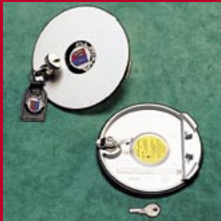
abschließbarer Aluminium Druckgußdeckel

mit abschließbarem Aluminium Druckgußdeckel