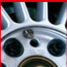
Ventil in die Radnabe integriert